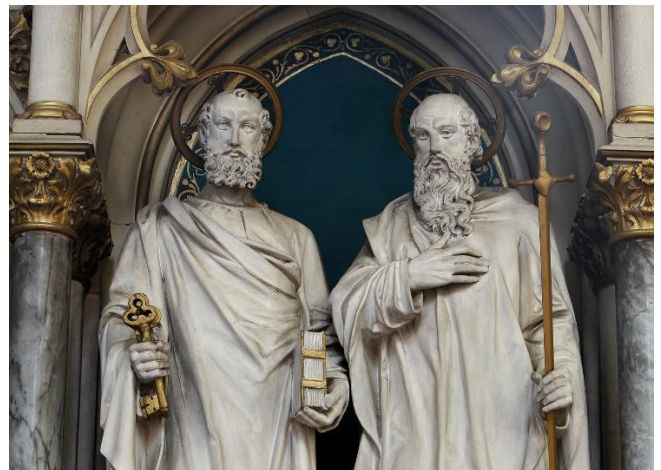
SS. Peter and Paul, Apostles